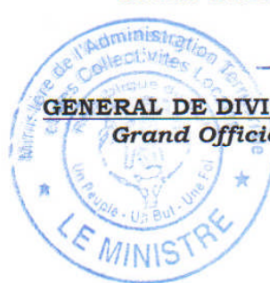
GENERAL DE DIVISION KAFUGOUNA KONE Grand Officier de l'Ordre National

Le Ministre de l'Administration Territoriale et des Collectivités Locales