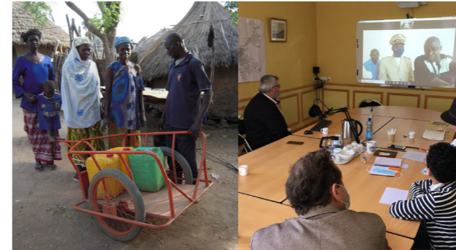
À Massonkolon on a éradiqué le port de l'eau sur la tête

Site internet : tapama.fr / Chaîne You Tube : ONG Tapama