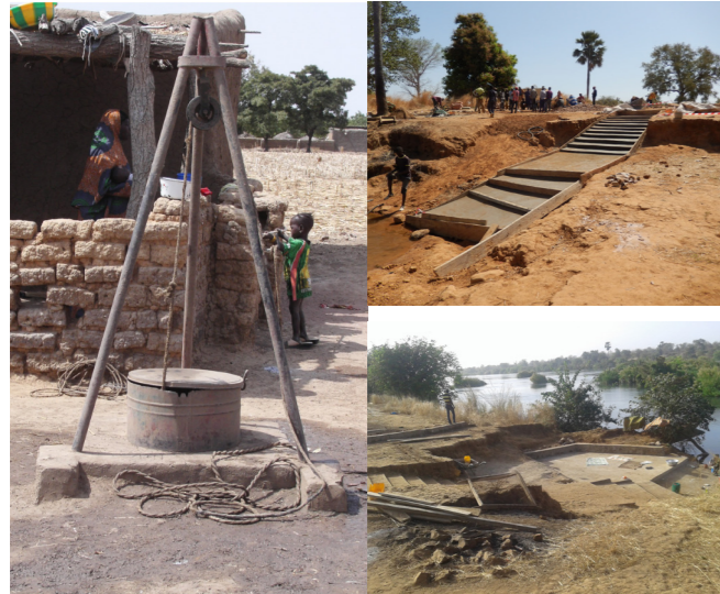
Puits de Sébénikoro