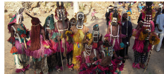
Les célèbres masques du Pays Dogon