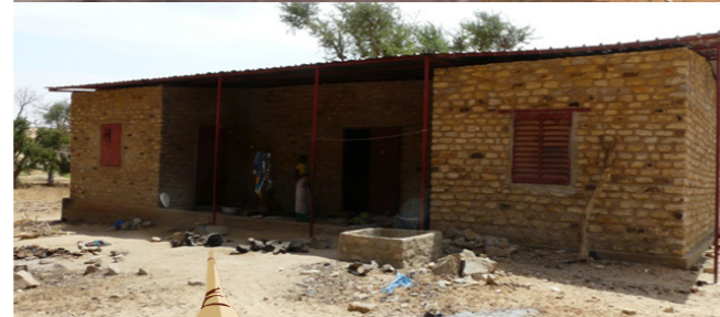
Construction d'un centre de santé (Nombori)