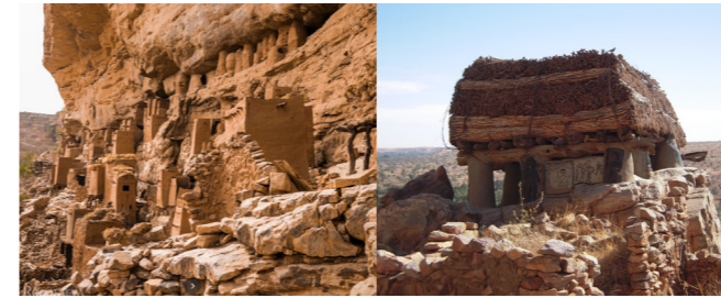
Les célèbres falaises et Tuguna du Pays Dogon

Cette région du Mali, jadis rattachée à la région 5 de Mopti, est devenue récemment une région administrative autonome et Bandiagara est sa capitale.